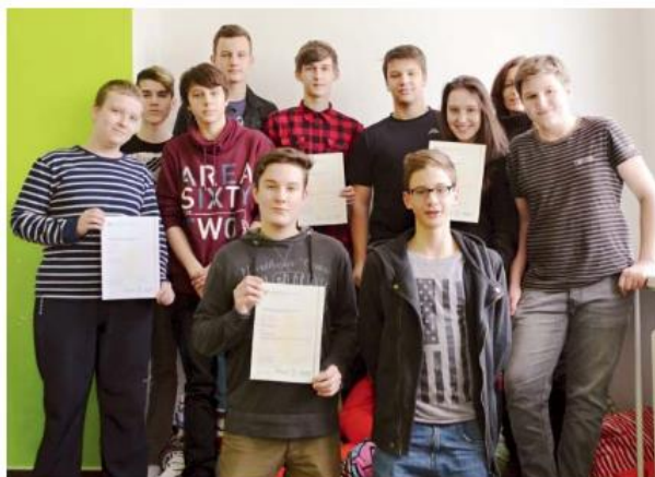
Žáci Základní školy na ulici Jana Šoupala uspěli v Cambridgeských zkouškách.

Tak vidíte, naše škola se nepyšní jenom úspěchy ve fotbale, ale může se chlubit i tím, že právě její studenti umí anglicky natolik dobře, že zvládnout KET zkoušky pro ně byla hračka. Fotky z této akce najdete na Fb školy.